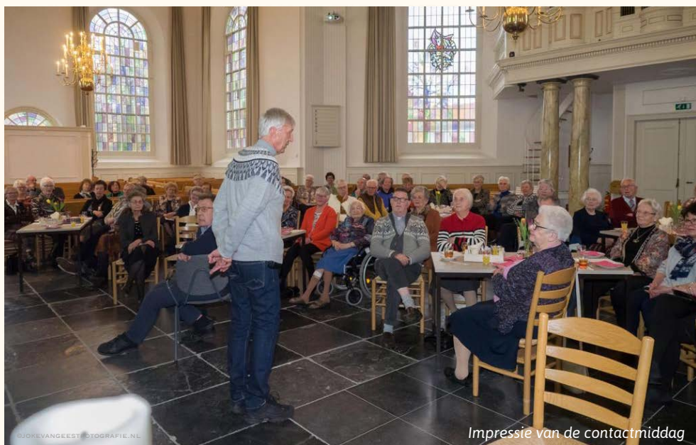
Impressie van de contactmiddag