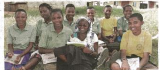
▲ Tuko Pamoja (boven) in Kenia, Mano a Mano in de Dominicaanse Republiek (midden) en Hart voor Afrika in Tanzania. Slechts drie van de gesteunde projecten.